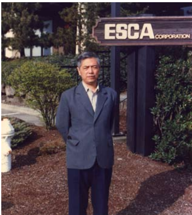
1986年美国电力系统计算机技术研究所（ESCA）

的4种状态估计算法中，试验选择出最适合的模型和算法；1979年，与清华大学的相年德和王世缨老师合作，提出多个不良数据的估计辨识法，同时还提出了零残差辨识法；1980年，在京津唐地区完成了局部电网实时状态估计试验；1985年，在湖北引进的CLASIC计算机上安装了状态估计软件，并进行了试运行。7年的研发，于尔铿从模型、算法等方面已赶上了国外先进水平，在不良数据辨识方面还有所提高，并出版了《电力系统状态估计》一书。该书被业内誉为学习状态估计的经典著作，是目前为止中文类电力系统状态估计著作中的代表之作。