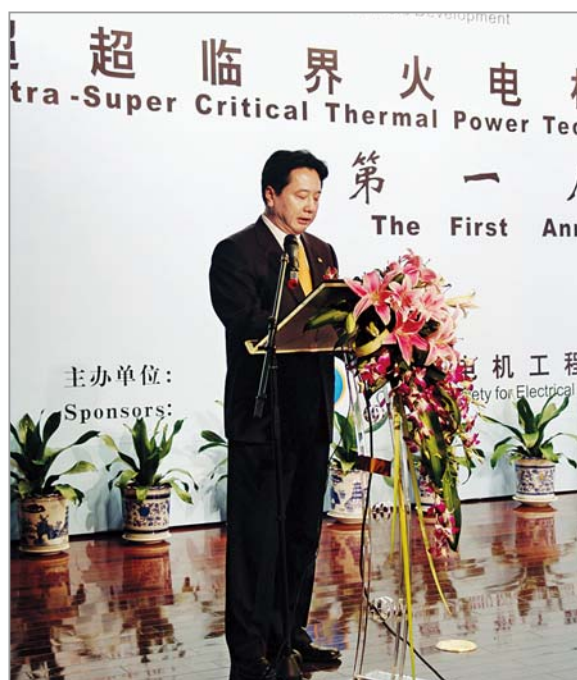
■ 2005年4月，温州，中国华能集团公司总经理李小鹏在超超临界火电机组技术协作网第一届年会上致辞