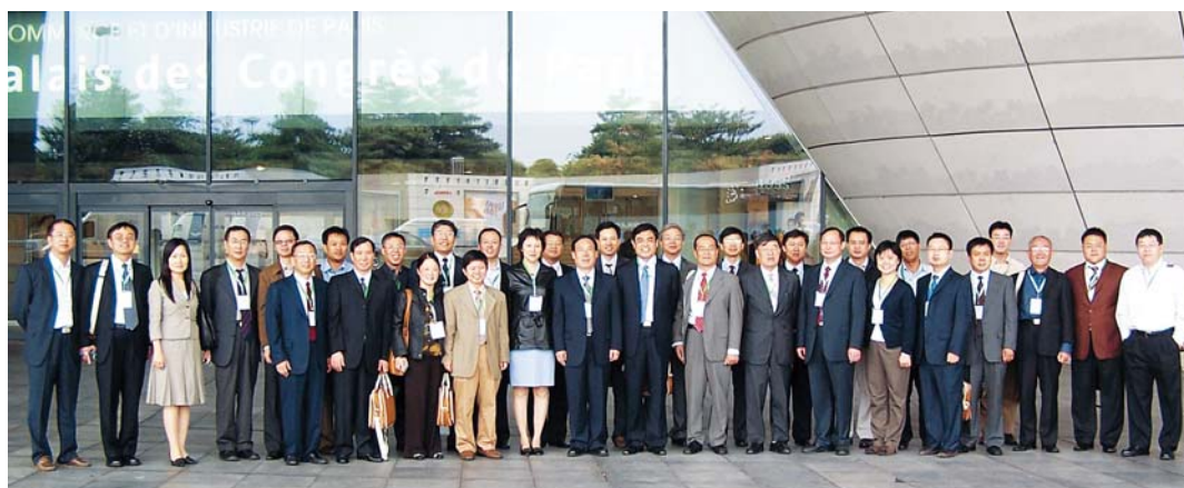
■ 2006年8月，参加法国巴黎举行的CIGRE大会中国代表团合影