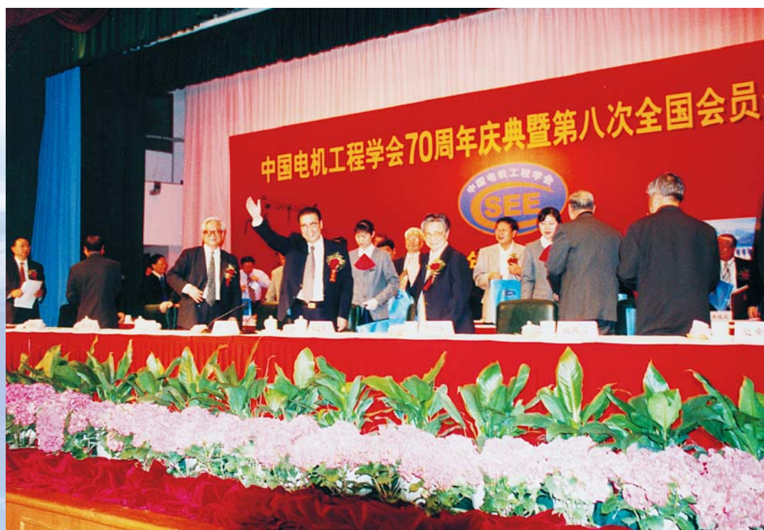
■ 李鹏出席中国电机工程学会成立70周年庆典