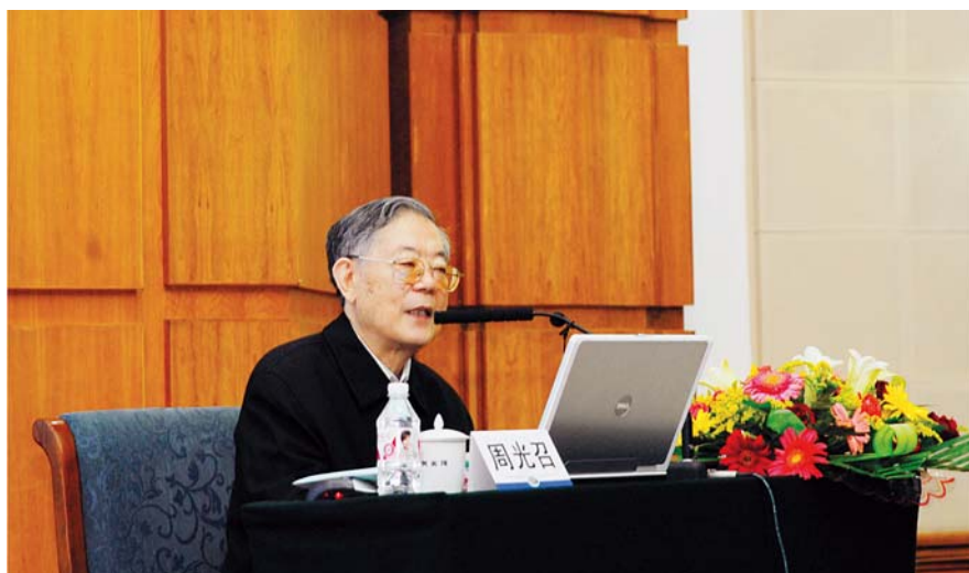
■ 2008年9月11日，周光召主席在中国电机工程学会第十届青年学术会议上作报告