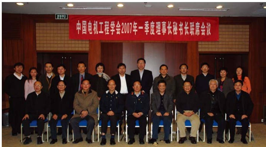
■ 2007年1月，北京，中国电机工程学会召开一季度理事长、秘书长联席会议

理事长、秘书长联席会议于2004年12月召开第一次会议。八届理事会期间，共召开了10次。在历次会议上确定每年学会工作重点。如2005年为“信息年”、2006年为“管理年”、2007年为“服务年”、2008年为“建设年”等，学会围绕主题年开展各项活动。