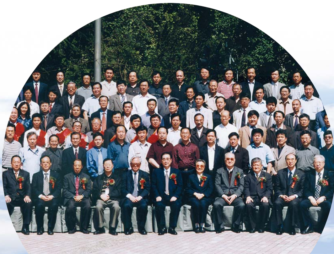
■ 2004年5月18日，出席中国电机工程学会建会70周年庆祝大会代表合影