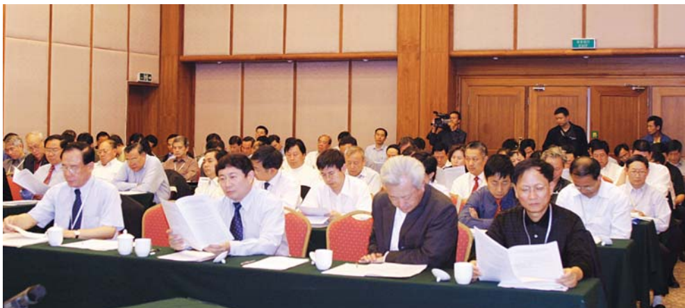
■ 2004年11月22日，海南兴隆，中国电机工程学会召开八届二次常务理事会

2004年11月，学会在海南省兴隆市召开八届常务理事会第二次会议，46名常务理事及其代表出席。会上通过“关于聘任各工作委员会主任、副主任、秘书的决定”、“中国电机工程学会办事机构预决算管理办法”等文件。会议同意建立正副理事长、正副秘书长联席会议制度，在理事会、常务理事会闭会期间，审议并决定学会日常工作中的重要事宜。