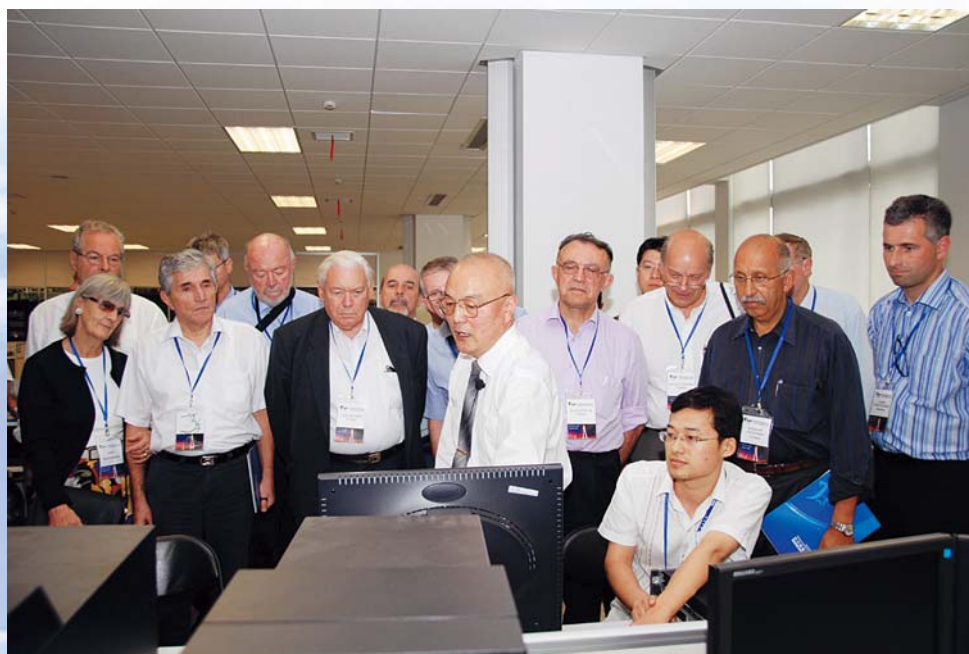
■ 2007年9月，CIGRE2007年理事会期间组织代表参观国网南京自动化研究院