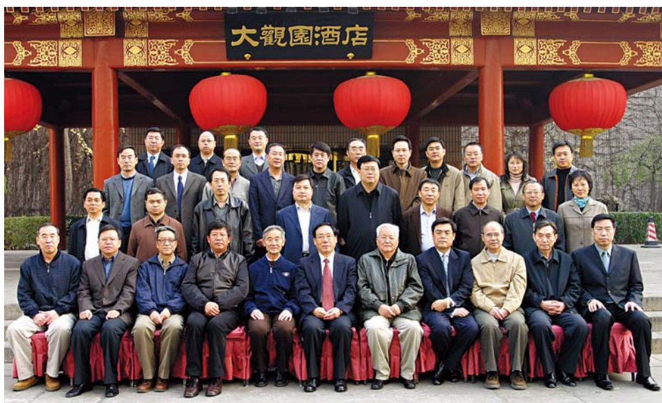
■ 2005年11月，CIGRE中国国家委员会委员合影

2006年10月，陆延昌主席与CIGRE主席Yves Filion在重庆市进行了会谈。双方就CIGRE中国国家委员会会员发展及工作组织、CSEE与CIGRE合作等事宜交换了意见，并取得了共识。