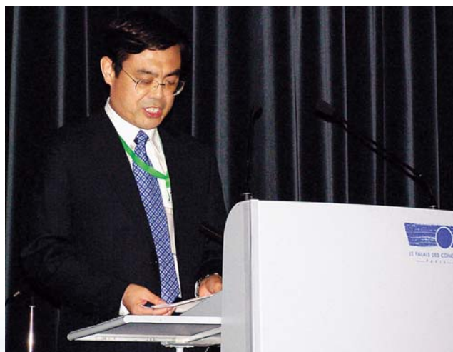
■ 2006年8月，国家电网公司副总经理舒印彪在CIGRE大会上作报告