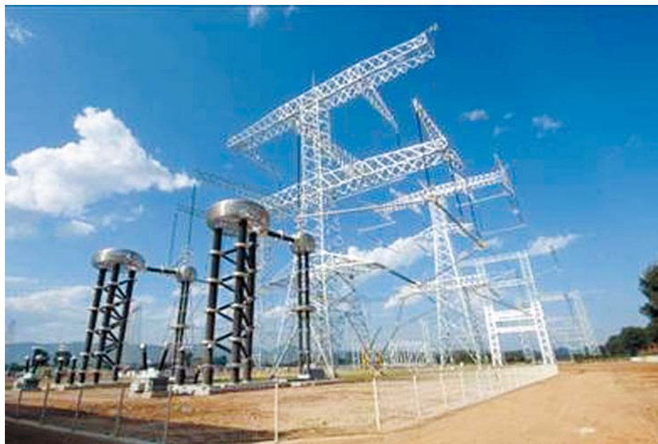
■ 中国电力科学研究院特高压直流试验基地