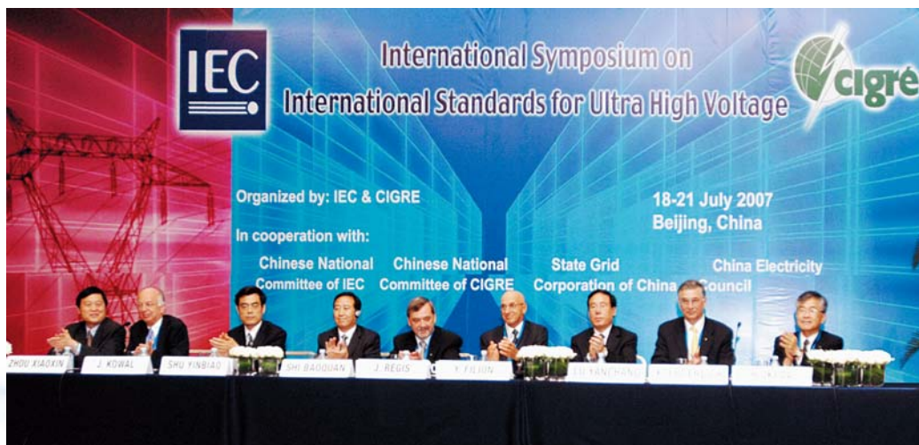
■ 2007年7月18日，北京，特高压国际标准研讨会会场

2007年7月，国际电工委员会（IEC）和国际大电网组织（CIGRE）联合在北京主办特高压国际标准研讨会（International Symposium on International Standards for Ultra High Voltage），会议由IEC中国国家委员会、CIGRE中国国家委员会、国家电网公司和中国电力企业联合会共同承办，来自18个国家的代表340余人（其中境外代表130余人）出席了会议，IEC当选主席Jacques Régis、CIGRE主席Yves Filion、IEC中国国家委员会秘书长石保权、CIGRE中国国家委员会主席陆延昌等在会议上发表演讲。与会代表共同探讨了特高压输电的技术发展、工程应用及标准化等问题，并就合作开展特高压技术领域的标准化工作达成共识。会议期间，学会还组织清华大学电机系学生与当选主席 Régis、CIGRE主席 Filion举行座谈。