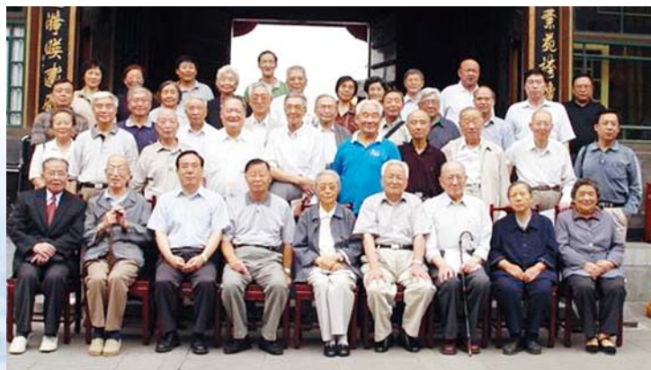
■ 2005年中秋联谊会合影照片

一年一度的中国电机工程界、北京电力科技界新春联谊会，已成为北京电力科技工作者尤其是老同志每年的盛会。电力系统部分在京老科技工作者春节茶话会、“三八”国际劳动妇女节部分离退休女科技工作者座谈会、端午节、中秋节老同志联谊会等，也已成为学会与离退休科技人员沟通的重要途径。