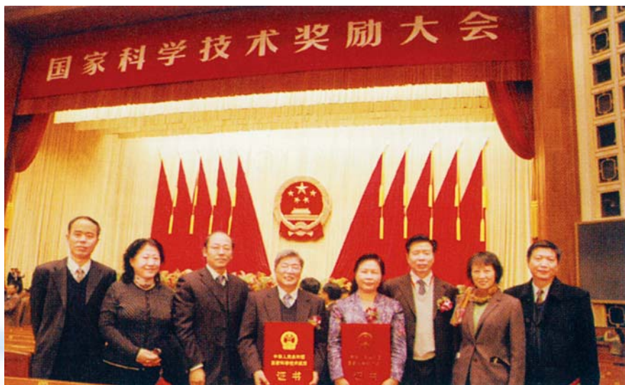
■ 2008年1月8日，2007年度国家科学技术奖励大会在北京人民大会堂隆重举行。党和国家领导人出席大会并为获奖代表颁奖

2007年，学会与中国机械工业联合会共同完成了“750kV示范工程”的技术评审验收工作；组织完成了我国600MW超临界依托工程——华能沁北电厂、国电大同第二发电厂600MW直接空冷全中水供水工程技术评审及110~500kV变电站主设备典型规范的调研和评审等。