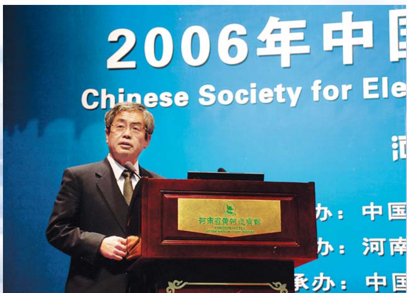
■ 2006年12月，郑州，日本电气工程师学会主席仁田旦三在中国电机工程学会2006年年会上作报告

2006年12月，在河南省郑州市召开中国电机工程学会2006年学术年会，与会代表400余名，录用论文396篇。陆延昌理事长和陆启洲、叶大戟、刘顺达、田勇、张