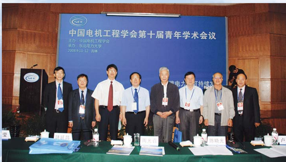
■ 2008年9月11日，吉林，中国电机工程学会第十届青年学术会议在东北电力大学召开

2008年9月，在吉林省吉林市（东北电力大学）召开中国电机工程学会第十届青年学术会议。第九届全国人大副委员长、中国科协名誉主席周光召院士应邀出席并作了题为“创新人才成长的过程和社会条件”的报告，引起与会代表的热烈反响。会议以“和谐电力与可持续发展”为主题。与会代表250余名，录用论文685篇。会议期间还组织了对于第一届到第十届青年学术会议的历史回顾图片展。本次会议确定下届青年学术会议由清华大学承办。