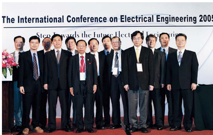
■ 2005年7月，昆明，第11届国际电机工程学术会议代表合影

联合召开2005年IEEE/PES亚太地区输配电国际会议，会议主题为“放松管制下的电网安全和可持续发展”，来自31个国家和地区的代表500余人（其中境外代表124人）出席了会议，录用论文472篇，会议包括特高压输电技术、电力市场的构建和运行、风力发电接入系统问题和电力系统广域保护等4个专题研讨会及35个分组会议，同期还举办了展览。