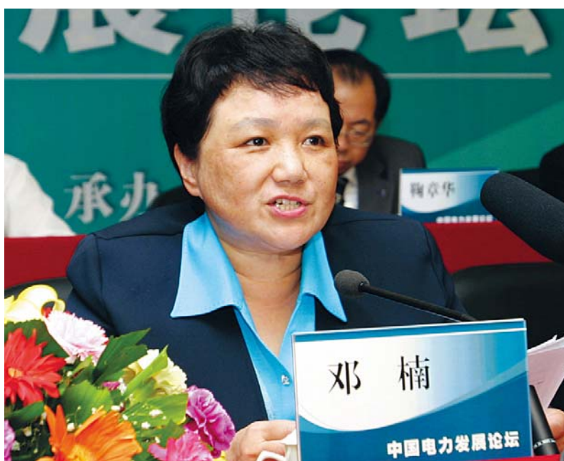
■ 2005年5月，张家界，中国科协党组书记邓楠在中国电力发展高层论坛上讲话