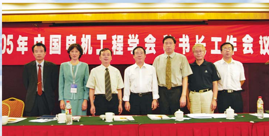
■ 2005年8月，乌鲁木齐，中国电机工程学会召开秘书长工作会议

从2006年起，每年年初召开秘书长工作会议，到2009年已召开了4次。会议及时交流工作经验，落实工作计划，听取各专委会（分会）和省级学会的意见和建议，加强了沟通。