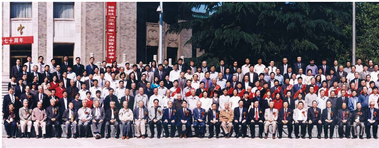
■ 2004年5月18日，出席中国电机工程学会建会70周年庆祝大会代表合影