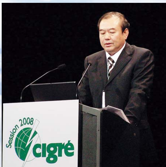
■ 2008年8月，国家电网公司副总经理郑宝森在CIGRE大会上作报告