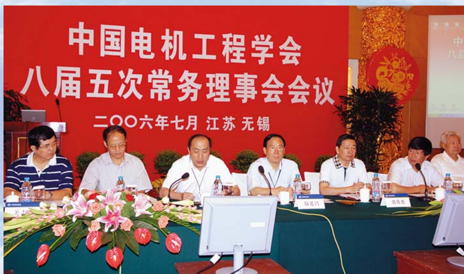
■ 2006年7月24日，无锡，中国电机工程学会召开八届五次常务理事会议

2006年7月，学会在江苏省无锡市召开八届常务理事会议第五次会议，出席会议的常务理事及其代表50余名。会议通过“关于中国电机工程学会工作委员会主任委员、副主任委员及秘书变更的建议”，以及“关于中国电机工程学会规范专委会工作的补充规定的建议”等。