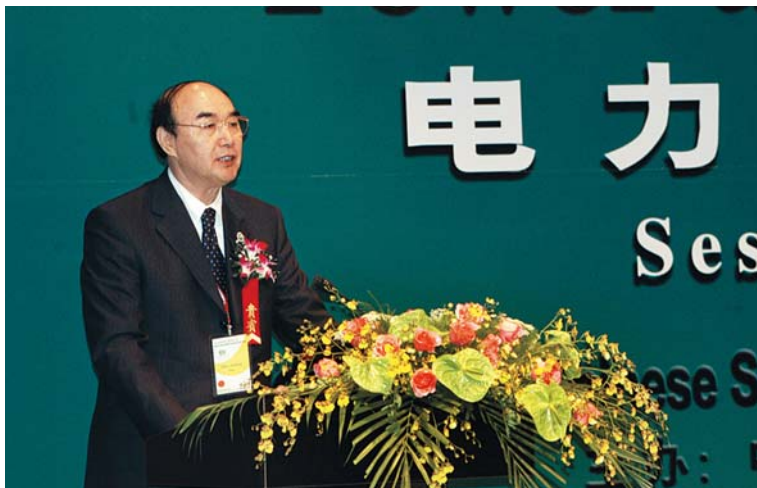
■ 2004年11月，中国电力企业联合会理事长赵希正在世界工程师大会上讲话

发展的主题，从不同侧面表达了中国电力企业在致力发展的同时对电力安全以及资源和环境保护的关注，体现出对社会和公众的责任感。本次会议充分发挥了电力与能源领域中外交流的平台作用。