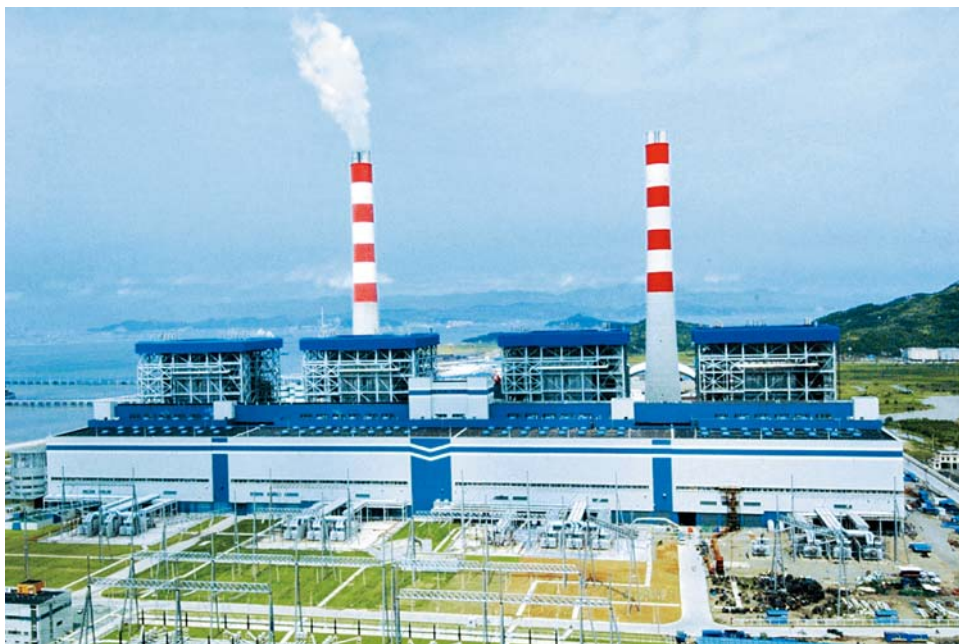
■ 我国首台1000MW超超临界机组于2007年在华能玉环电厂投入运行，图为装有4台百万千瓦超超临界机组的华能玉环电厂全貌