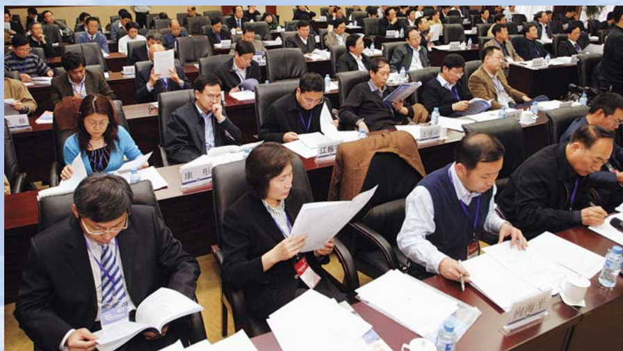
■ 2008年11月17日，西安，中国电机工程学会八届四次理事会会场

2008年11月，学会在陕西省西安市召开八届常务理事会第八次会议和八届理事会第四次会议，45名理事及其代表出席会议。会议原则通过“中国电机工程学会部分专委会调整的初步方案”，将现有34个专委会重组为27个专委会。通过设立会士的建议。会议还讨论了第九次全国会员代表大会的筹备工作。