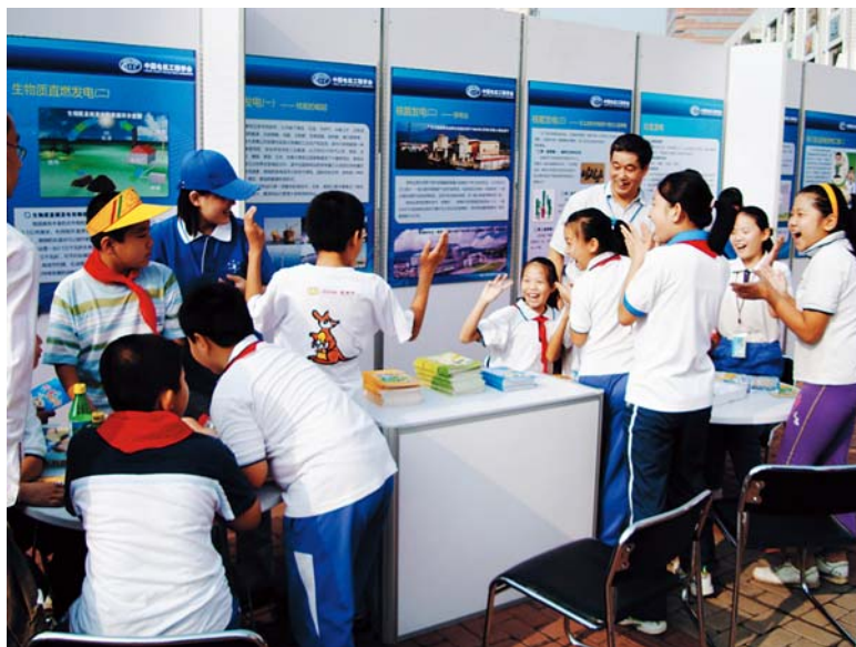
■ 2008年9月20日，北京，全国科普日北京分会场中国电机工程学会展位