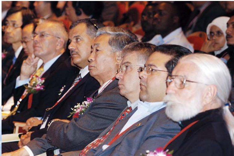
■ 2004年11月，世界工程师大会会场

2005年7月，学会作为东道国主办在云南省昆明市召开第十一届国际电机工程学术会议（ICEE2005），来自16个国家和地区的代表共428人（其中境外代表270人）出席，会议以“迈向电气工程的未来”为主题，涵盖电气与电子材料、电力系统规划和运行、电力系统模拟与分析、电力市场和经济性、高压直流和灵活交流输电系统等技术领域，录用论文427篇；同年8月，学会在辽宁省大连市与IEEE/PES