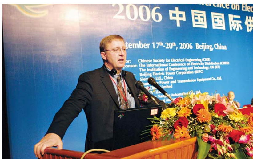
■ 2006年9月，北京，CIGRE主席Adolf Schweer在2006中国国际供电会议上作报告