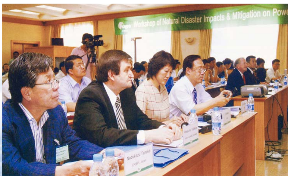
■ 2008年5月29日，北京，自然灾害对电力设施的影响与应对报告会会场

在中国地震学会的协助下，学会在研讨会后邀请和组织来自中国地震灾害防御中心和输电线路、电力土建、变电、火力发电等专委会（分会）及四川省电机工程学会的有关专家，就汶川地震电力设施破坏情况、电厂建筑防震和电力设备防震等问题开展调研工作，并于2009年2月完成了《地震对电力设施影响及应对调研报告》。