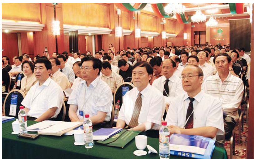
■ 2005年8月，乌鲁木齐，中国电机工程学会2005年年会会场

提出机网协调问题，认为新疆风电应分散有序开发，和其他电源协调发展。“北斗一号卫星定位与定时”报告的新成果介绍，引起与会者关注。学会组织有关设备制造企业代表和北斗一号的专家在会下进行了交流。会议期间，学会和新疆维吾尔自治区经贸委联合举办了新疆能源开发利用与煤电一体化发展论坛。