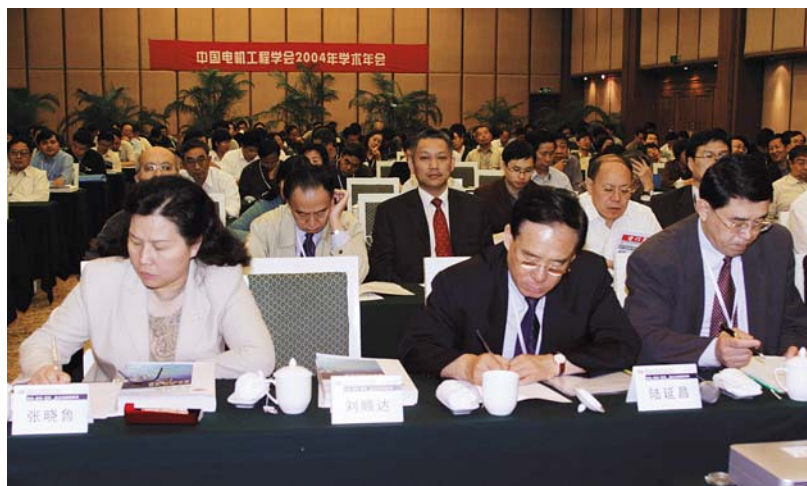
■ 2004年11月，海南兴隆，中国电机工程学会2004年年会现场

2004年11月，在海南省兴隆市召开中国电机工程学会2004年学术年会。年会的主题为“安全、高效、环保，走电力可持续发展之路”，本次会议也是中国科协2004年学术年会电力分会场。会议录用论文185篇，共254名代表参会，包括4位工