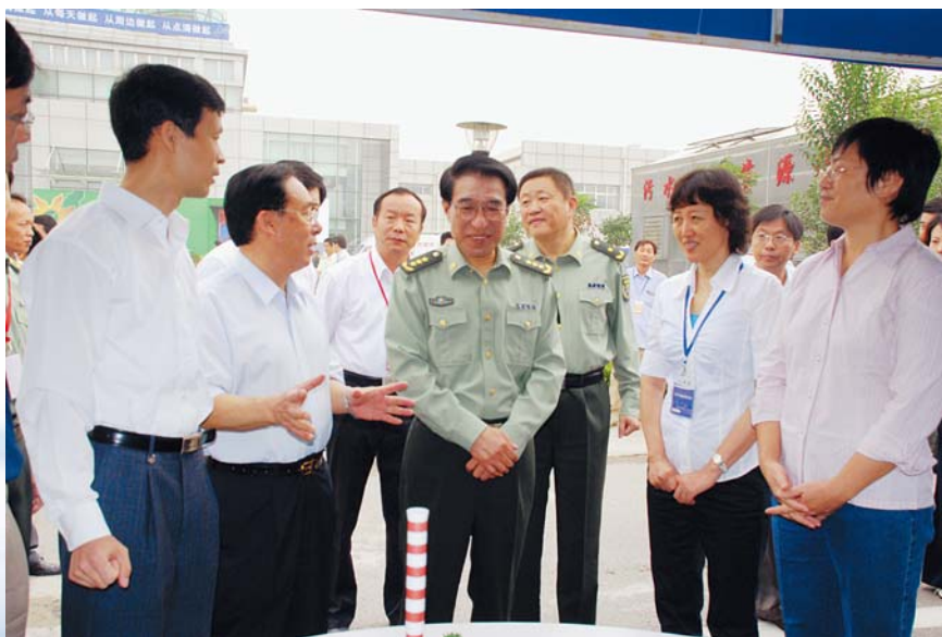
■ 2007年9月15日，北京，科普日期间，中央书记处书记、中央军委副主席徐才厚参观电机工程学会展位

2007年9月，学会参加了由中国科协组织的2007年全国科普宣传日主会场活动。围绕“节约能源资源、保护生态环境、保障安全健康”和“节能减排，从我做起”的主题，以模型演示、信息触摸屏互动、展板展示、知识有奖问答、专家现场咨询、宣传册和节能用品发放等多种形式，宣传“绿色能源、节约用电、安全用电”。中共中央政治局常委、国家副主席曾庆红，中央书记处书记、中央军委副主席徐才厚，中央书记处书记王兆国等参观了学会展位，了解可再生能源发电、电力生产过程中有关脱硫减排、节能降耗等重大新技术。陆延昌理事长等学会领导亲自作讲解。