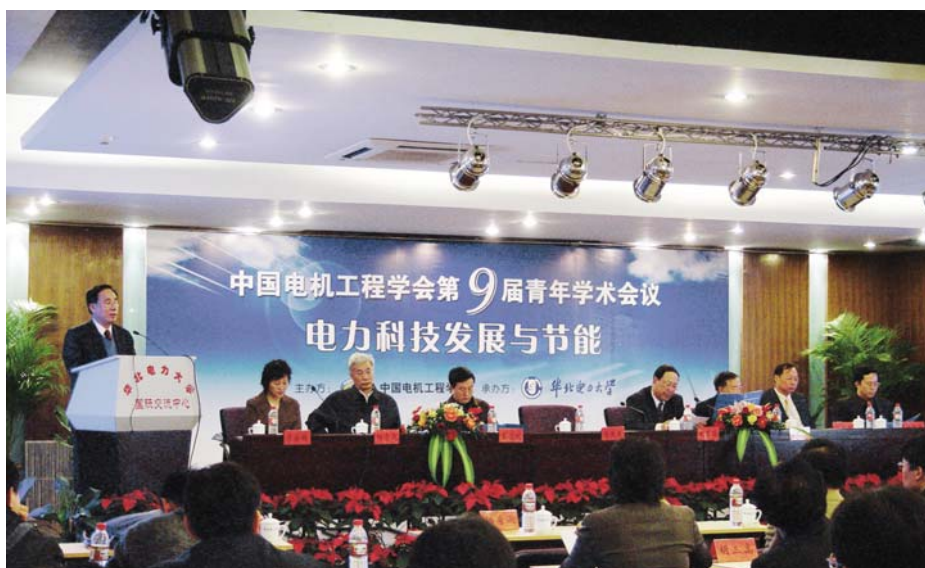
■ 2006年11月，北京，中国电机工程学会第九届青年学术会议在华北电力大学召开

2008年9月，在吉林省吉林市（东北电力大学）召开中国电机工程学会第十届青年学术会议。第九届全国人大副委员长、中国科协名誉主席周光召院士应邀出席并作了题为“创新人才成长的过程和社会条件”的报告，引起与会代表的热烈反响。会议以“和谐电力与可持续发展”为主题。与会代表250余名，录用论文685篇。会议期间还组织了对于第一届到第十届青年学术会议的历史回顾图片展。本次会议确定下届青年学术会议由清华大学承办。