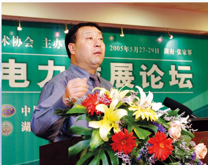
■ 2005年5月，张家界，国家电网公司总经理刘振亚在中国电力发展高层论坛上作特邀报告