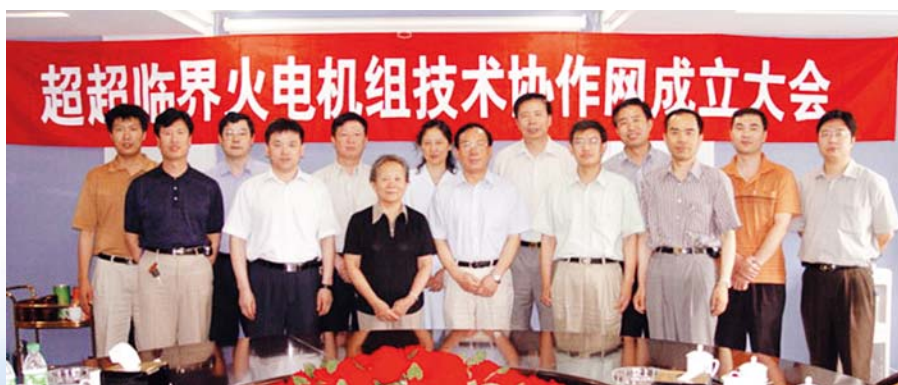
■ 2004年7月22日，超超临界火电机组技术协作网成立

2004年7月，中国电机工程学会和中国华能集团公司、中国电力投资集团公司、中国大唐集团公司、中国华电集团公司、中国国电集团公司、北京国华电力有限责任公司、国投电力公司共同发起建立“超超临界火电机组技术协作网（以下简称协作网）”，并议定每年召开1次年会，由学会与各发电公司轮流共同举办。