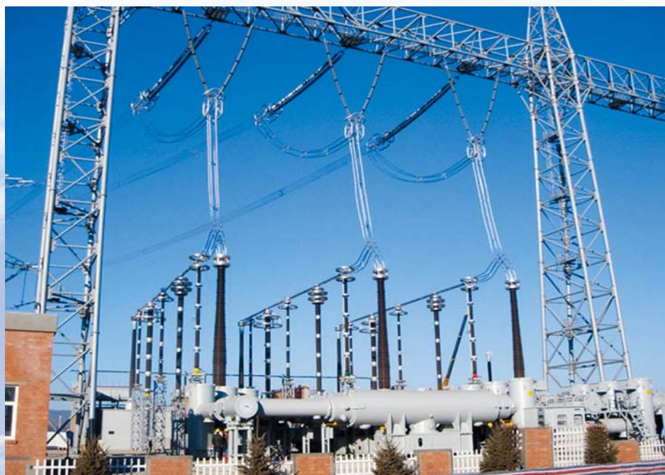
■ 晋东南—南阳—荆门1000kV特高压变电站