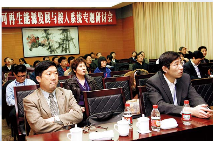
■ 中国电机工程学会2008年年会可再生能源发展与接入系统专题研讨会会场