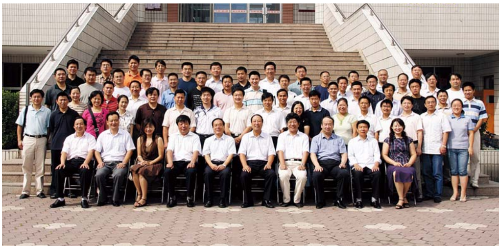
■ 2007年8月27日，第二期动力与电气工程师国际互认培训班在华北电力大学合影

联合英国工程技术学会（IET）进行第一批工程师资格国际互认试点的面试，其中有9人获得中国电机工程学会工程师资格认证证书及IET颁发的企业工程师（I-Eng）证书；8月至9月举办了第二期培训及面试，有41人获得中国电机工程学会工程师资格认证证书及IET颁发的工程师认证证书，其中37人获得企业工程师（I-Eng）证书，4人获得特许工程师（C-Eng）证书。