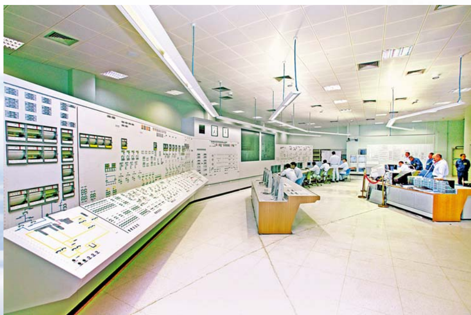
■ 田湾核电站全数字化仪控系统主控室